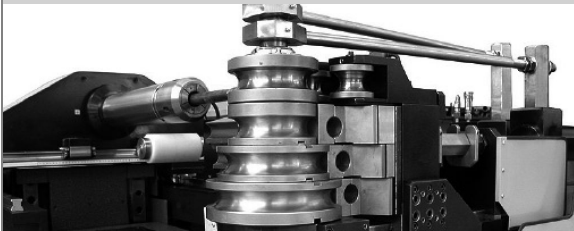
PROVAR 6 U-D