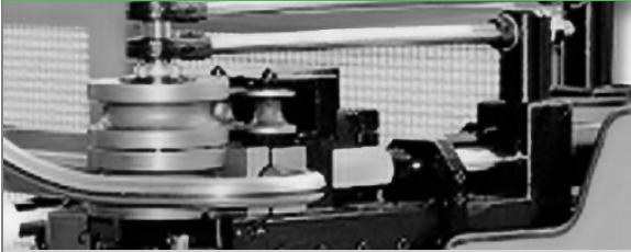
PROVAR 5 U-D