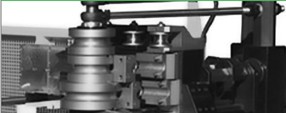
PROVAR 6 U-D