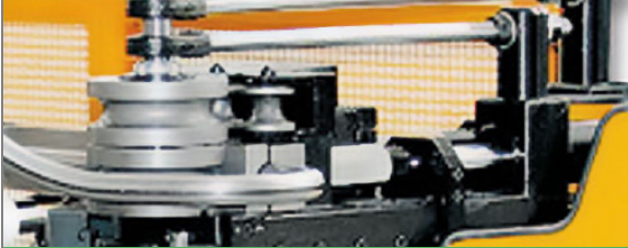
PROVAR 5 U-D